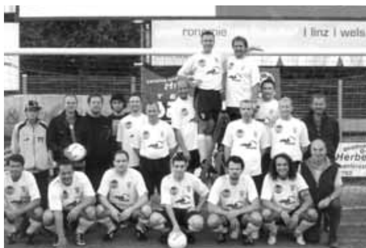
Ein zusammengeschweißtes Team: DSG-Mannschaft 2007

Jeden Mittwoch ab 19 Uhr treffen sich die DSG-Fußballer am Thalheimer Sportplatz und gehen ihrer liebsten Leidenschaft nach. Alle Freunde des "runden Leders" sind herzlich zu den Trainings eingeladen!