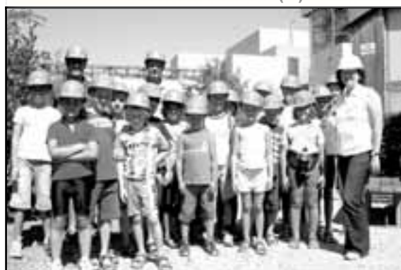
Ausflug mit dem Rad 6.8.07

DAS WAR DER FERIEN(S)PASS 2007 ► EINIGE EINDRÜCKE ...