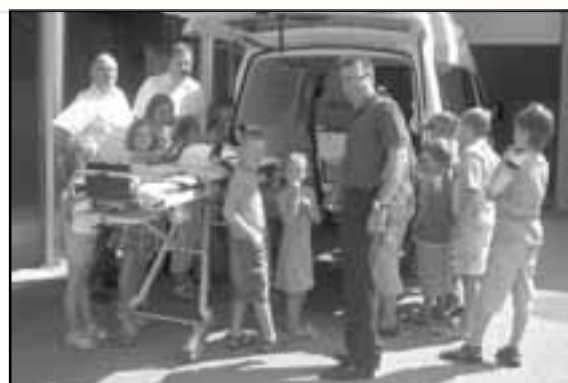
Erste Hilfe Kurs 20.7.07