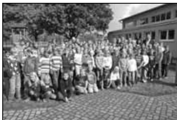
Auffrischungslernwoche 03. bis 7.9.07

Hinweis: Familienfest der Union-Turnen anl. des 40-Jahr-Jubiläums. Info auf Seite 14