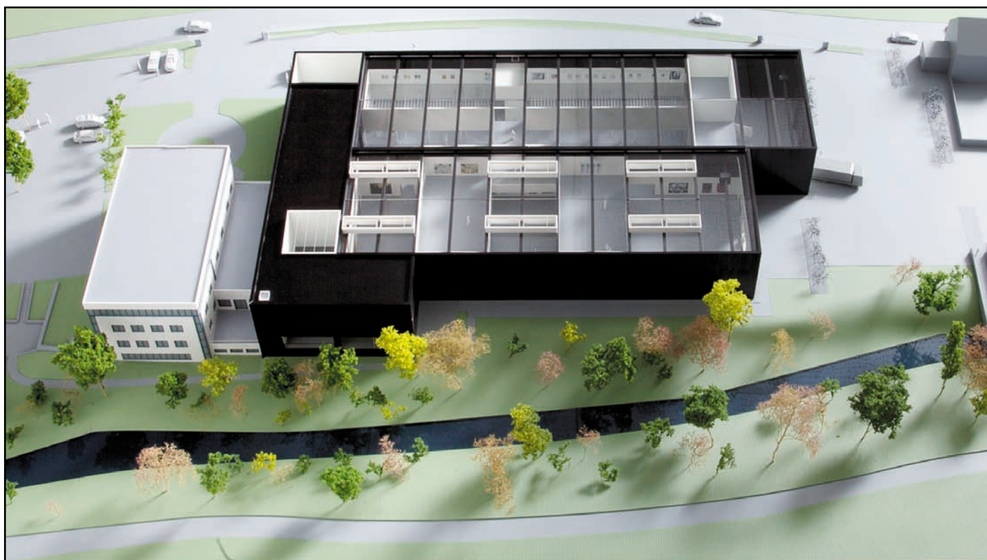
Das Museum Angerlehner, wie es sich ab September 2013 präsentieren wird.

Über seine Motivation sagt der Sammler: „Ich will auf keinen Fall in Konkurrenz zu den öffentlichen Museen treten, sondern die Kunstlandschaft Oberösterreichs mit meiner subjektiv geprägten Sammlung ergänzen und bereichern. Dass das Museum hier in meiner Heimatregion eröffnet wird, ist mir ganz besonders wichtig.“