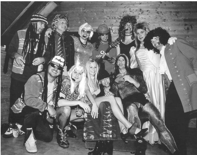
Gute Ideen surfen in die Herzen der Gäste - weiter auf Erfolgskurs: Die DSG SHOW - STARS

Am 2.2.2002 strömten die Thalheimer und Welser Freunde der DSG-Sportler in den Pfarrhof. Die Diözesan-Sport-Gemeinschaft lud zur schon traditionellen Ballveranstaltung. Das Motto 2002: „pizza, pasta & prosecco“