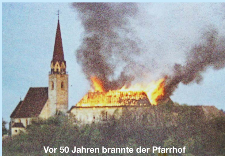
Vor 50 Jahren brannte der Pfarrhof