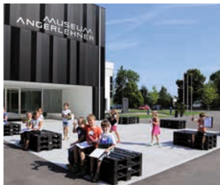
Kunstvermittlung wird im Angerlehner Museum groß geschrieben.

Die viel beachtete Messensee-Ausstellung „Jenseits der Gegensätze“ in den vier Galerieräumen des Obergeschoßes ist noch bis 19. Oktober zu besichtigen.