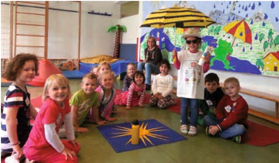
Auf spielerische Art und Weise wurde den Thalheimer Kindern das Thema „Sonnenschutz“ näher gebracht.

Seit Frühjahr 2007 bietet die Krebshilfe Oberösterreich in Kindergärten ein Hautkrebs-Vorsorgeprojekt im Rahmen von „Sonne ohne Reue“ an.