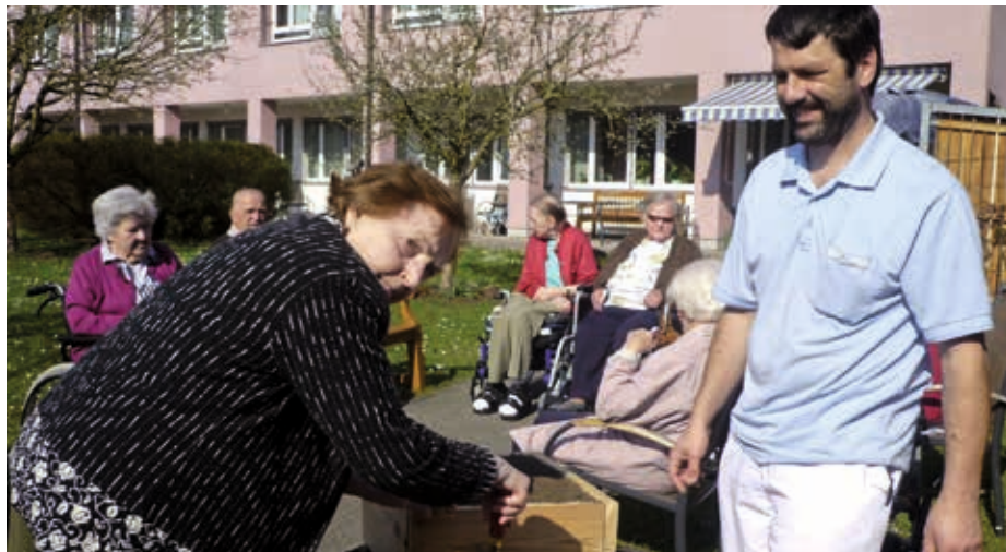
Die Bewohnerinnen und Bewohner des Bezirksalten- und Pflegeheimes Thalheim bewiesen einen grünen Daumen und ernteten die Früchte ihrer Arbeit.

Im Bezirksalten- und Pflegeheim Thalheim drehte sich kürzlich alles rund um den heimischen Erdapfel.