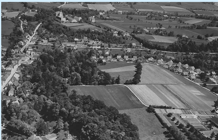
Luftaufnahme Thalheim, 1960er-Jahre