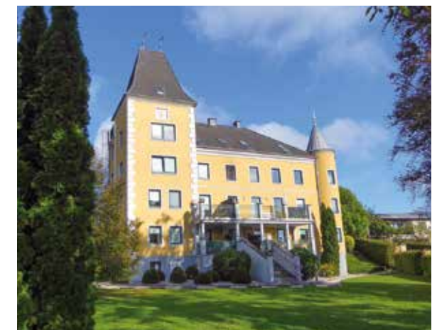
Das Herrenhaus heute