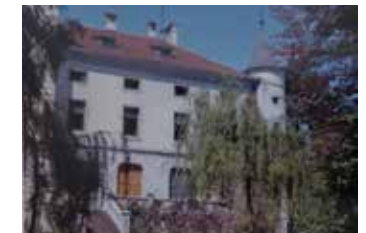
Das Herrenhaus im alten Anstrich (undatiert)

Nach mehreren Sanierungen und nach dem Einbau von Wohnungen dient das Gebäude heute ausschließlich privaten Wohnzwecken.