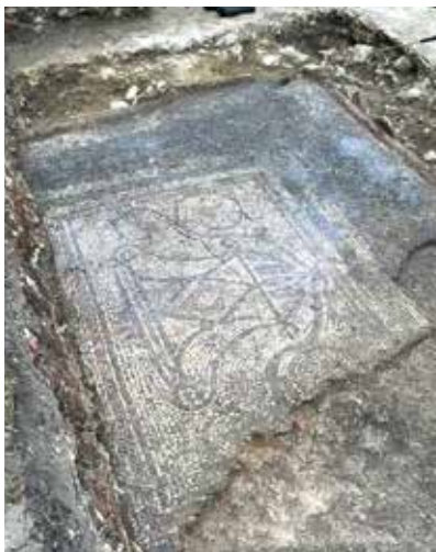
Im Frühjahr 2024 legte das Archäologenteam am Reinberg ein fast perfekt erhaltenes römisches Mosaik frei.

Ein besonders seltenes Fundstück römisch-antiker Wohnkultur gelang dem Archäologenteam bei den 2024 fortgesetzten Ausgrabungen: Oberhalb des Ortsteils Aschet wurden ein fast vollständig erhaltenes Bodenmosaik, Teile einer Mauer und eines Ofens freigelegt. Dieser Fund ist in seiner Unversehrtheit erst der dritte dieser Art in Oberösterreich. Derzeit laufen bereits Überlegungen, wie dieses antike Erbe gesichert der Öffentlichkeit zugänglich gemacht werden kann.