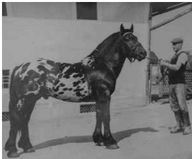
Der Pferdehof blieb erhalten

Seine erste gesicherte Erwähnung findet der „Prukhof“ um 1325 (vgl. Dichtl, 1966; nach Holter bereits 1189 ). Der Name leitet sich von dessen Lage als erstes Gut nach der Brücke ( heute Alte Traunbrücke, Anm. ) ab. Dokumentiert ist ein Brand des Hofes am 5. Oktober 1859. Über Jahrhunderte stand er dort mit einigen Nebengebäuden alleine, ehe 1903 das sogenannte „Herrenhaus“ (auch „Schlössl“) errichtet wurde. Nur wenige Straßen weiter entstand zehn Jahre davor die „Bruckhofvilla“.