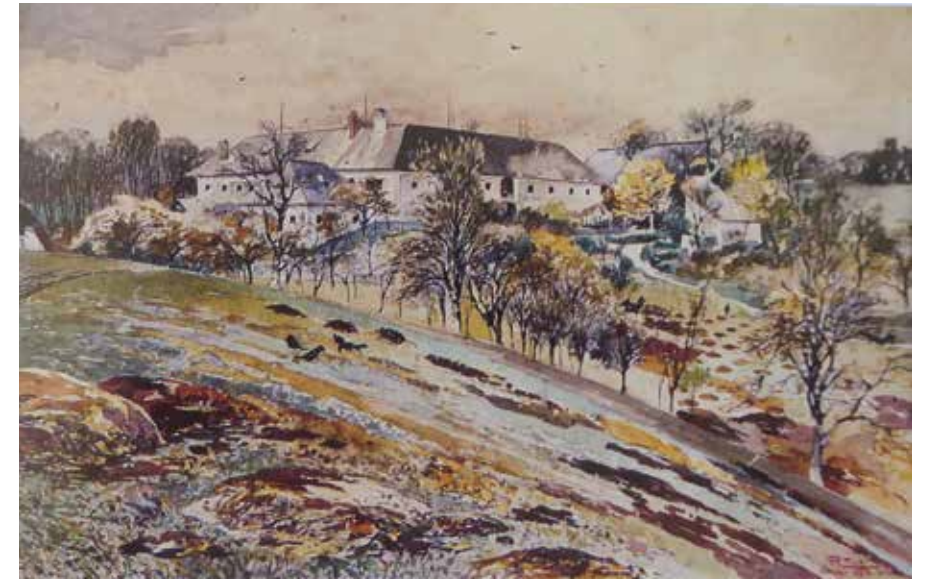
Der Bruckhof um 1896 (Ostansicht; Aquarell von Zich)

Anlässlich des von der Gemeinde Thalheim veranstalteten Römerfestes nutzten rund 400 Interessierte die Gelegenheit, das freigelegte Mosaik bei Führungen aus der Nähe zu bestaunen und sich über die historischen Hintergründe zu informieren. Anschließend wurde die Ausgrabungsstätte wieder fachgerecht zugeschüttet und wartet auf die Rückkehr des Forscherteams, das seine Arbeiten im Frühjahr 2025 fortsetzen wird, um weitere Geheimnisse der einstigen Römervilla zu lüften.