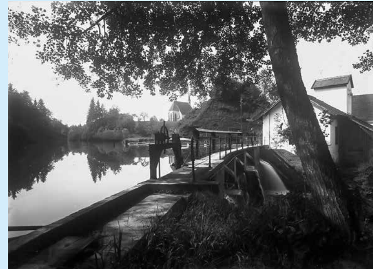
Wehranlage beim Aiterbach in Schauersberg