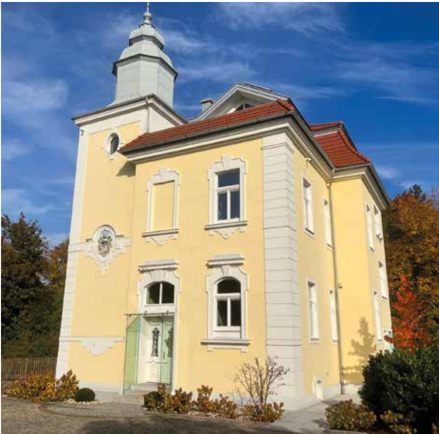
Die Bruckhofvilla – Südseite mit Eingang

Beitrag: Gertraud Marschallinger, Oliver Inzinger