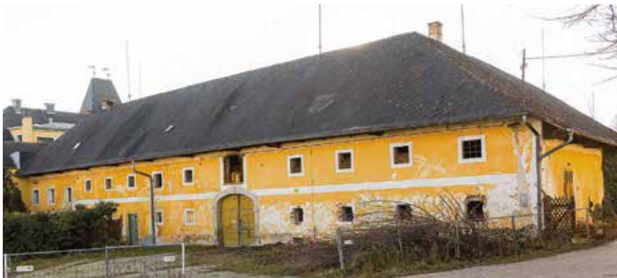
Der Bruckhof kurz vor dem Abriss

Bekannt war und ist der Bruckhof bis heute für den in den späten 1950er Jahren entstandenen und erhalten gebliebenen Pferdehof. In der zweiten Hälfte des 20. Jahrhunderts setzte auf dem Reinberg rege Wohnbautätigkeit ein. 2016 erwarb eine Immobilienfirma den Bruckhof und schleifte diesen schlussendlich.