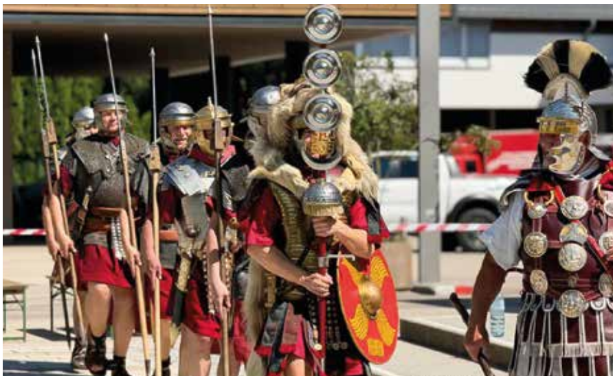
Beim Römerfest 2024 zeigte die Gruppe „Legio XV Apollinaris“ Exerzierübungen und gab Einblicke in das Leben und die Ausbildung römischer Soldaten.